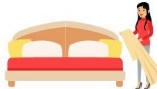
触碰床单或马桶座椅