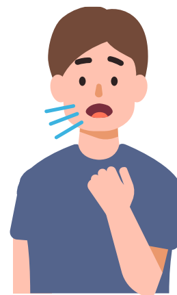
Batuk berterusan selama 2 minggu atau lebih lama