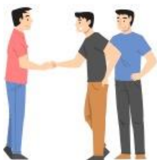
Berjabat tangan dengan seseorang