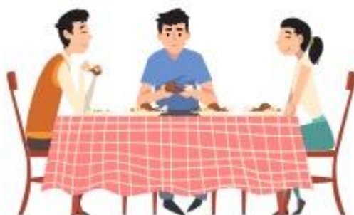
Berkongsi makanan atau minuman