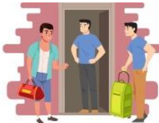
Berkongsi ruang tertutup untuk tempoh yang lama