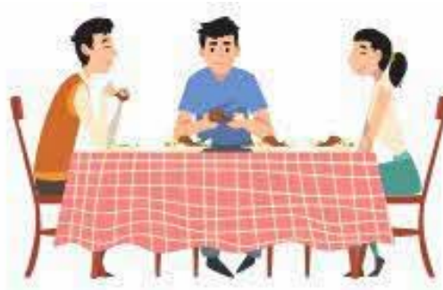
உணவு அல்லது பானத்தைப் பகிர்ந்துகொள்வது