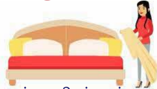
படுக்கைத் துணிகள் அல்லது கழிப்பறை இருக்கைகளைத் தொடுவது