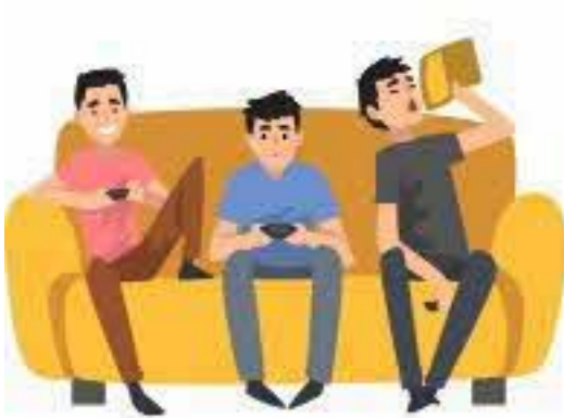
ஒரே வீட்டில் வசிப்பது