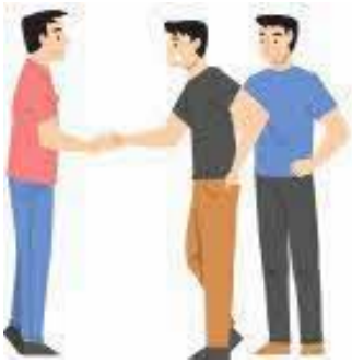
ஒருவரின் கையைக் குலுக்குவது