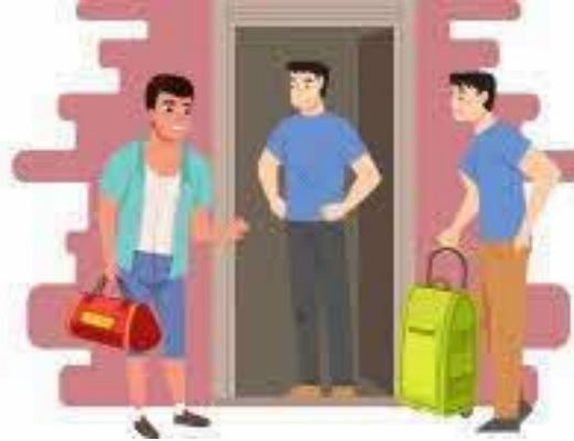
காற்றோட்டம் இல்லாத ஒரே அறையில் நீண்ட நேரம் பகிர்ந்துகொள்வது