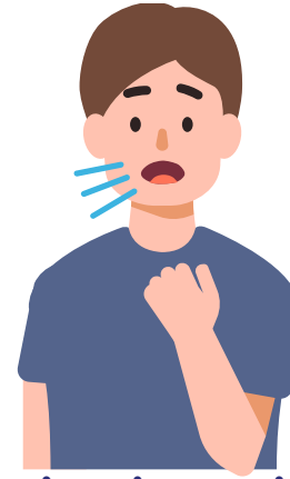
2 வாரங்கள் அல்லது அதற்கு மேல் இடைவிடாத இருமல்